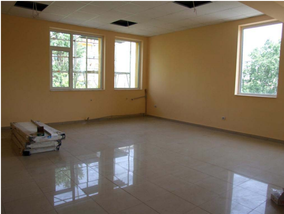
Sala în care va fi amenajat cabinetul oftalmologic

Complexul de Servicii Sociale „Sf. Nectarie” este unitate de asistență socială, fără personalitate juridică, în cadrul Direcției Generale de Asistență Socială și Protecția Copilului Sector 6 (D.G.A.S.P.C. Sector 6), înființat prin Hotărâre a Consiliului Local al Sectorului 6, București. Complexul de Servicii Sociale „Sf. Nectarie” funcționează în Municipiul București, la adresa din B-dul Uverturii, nr. 81, Sector 6.