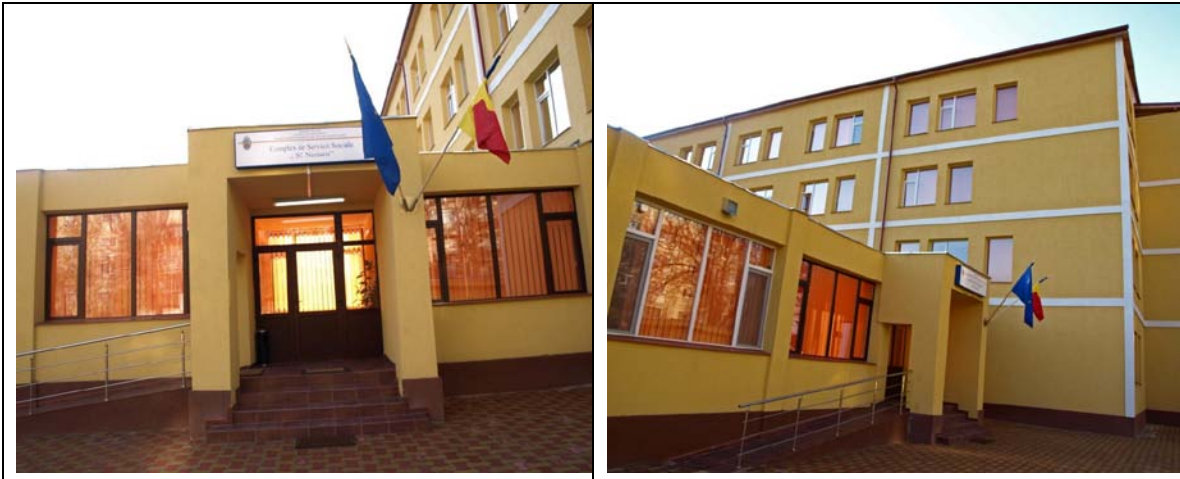
Complexul de Servicii Sociale "Sf. Nectarie" în care va fi amplasat cabinetul

Complexul de Servicii Sociale „Sf. Nectarie” este unitate de asistență socială, fără personalitate juridică, în cadrul Direcției Generale de Asistență Socială și Protecția Copilului Sector 6 (D.G.A.S.P.C. Sector 6), înființat prin Hotărâre a Consiliului Local al Sectorului 6, București. Complexul de Servicii Sociale „Sf. Nectarie” funcționează în Municipiul București, la adresa din B-dul Uverturii, nr. 81, Sector 6.