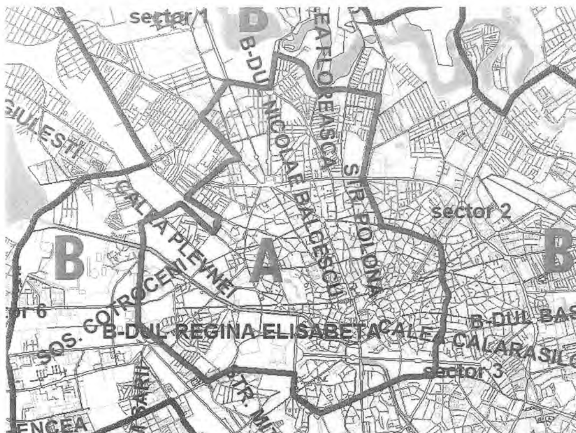
Delimitarea „zonei verzi” conformă cu zona A stabilită de HCGMB 134/2004