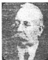
GHEORGHE LONGINESCU (1869 —1936)

Uneori oamenii sînt supuși la încercări grele: așa s-a întîmplat și cu chimistul Gheorghe Longinescu , care deși a suferit 17 operații la ochi — în ultima parte a vieții sale era aproape orb — această infirmitate nu l-a putut împiedica să-și desfășoare activitatea de profesor universitar, de cercetător neobosit în domeniul atît de vast și de fascinant al chimiei, să pășească neșovăitor pe drumul anevoios, dar fertil al descoperirii, al creației.