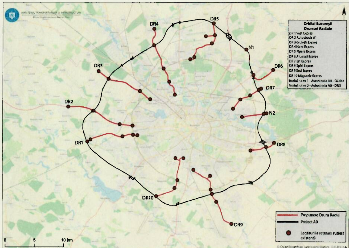
Figura 1 - Harta drumurilor radiale ce fac parte din proiectul Orbital București

Lungimile și costurile prezentate mai sus, reprezintă estimări rezultate în urma analizelor de favorabilitate dezvoltate pentru fiecare dintre proiecte și realizate de către experții Ministerului Transporturilor și Infrastructurii (Direcția Generală Strategie) respectiv ai Asociației de Dezvoltare Intercomunitară Zona Metropolitană București (ADIZMB).