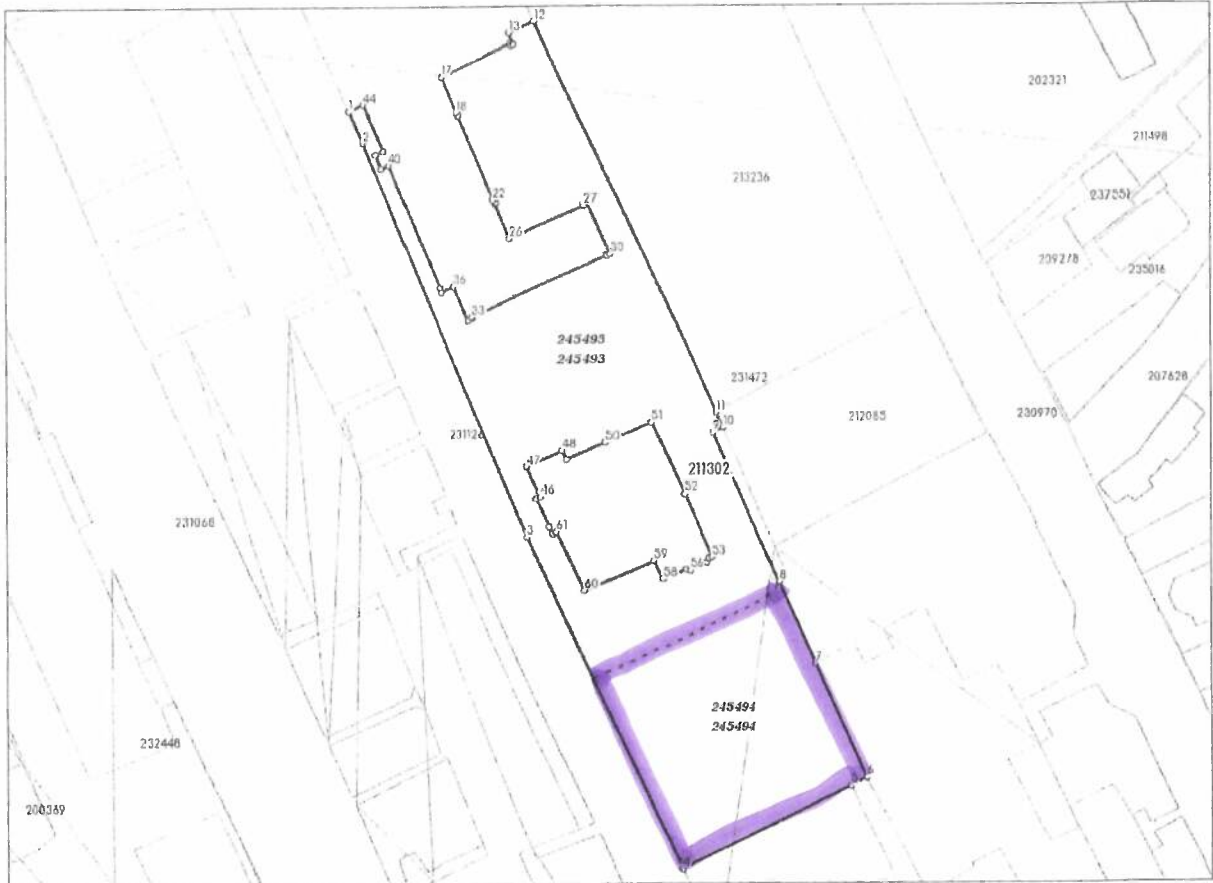
DETALII LINIARE IMOBIL

* Suprafața este determinată in planul de proiecție Stereo 70.