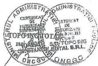
Sistem de Protectie Stereo Bucuresti